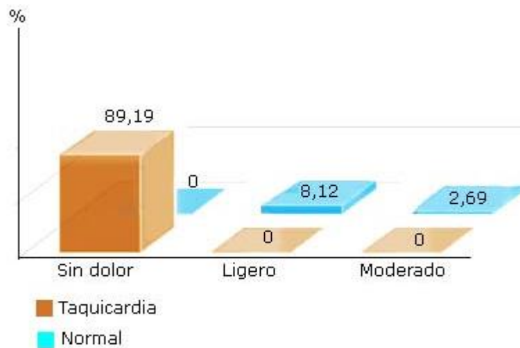
Fig. 2. Distribución de los pacientes según el comportamiento de la frecuencia cardiaca y la respuesta analgésica.

Con respecto a la función respiratoria, que incluye la frecuencia respiratoria y la saturación parcial de oxígeno, esta se mantuvo siempre estable dentro de parámetros normales en el 100 % de los pacientes estudiados, con oscilación entre valores mínimo de 97 % y máximo de 100 % para la SpO 2 . La media encontrada para esta variable fue de 99,48 ± DE 0,78 %. Para la frecuencia se mantuvo un valor promedio de 16 resp/min.