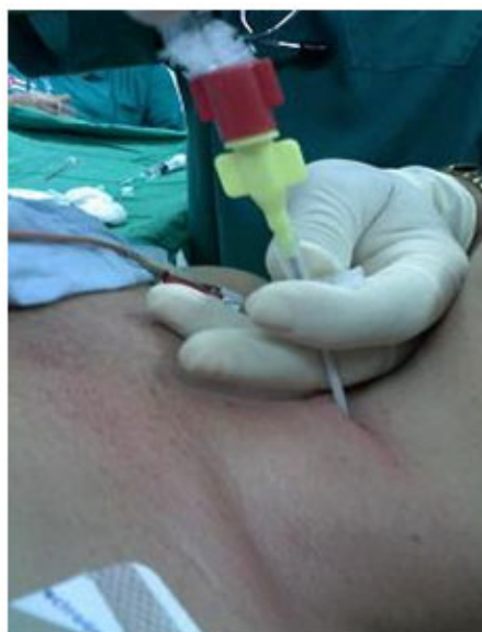
Fig. 4. Introducción de la guía.