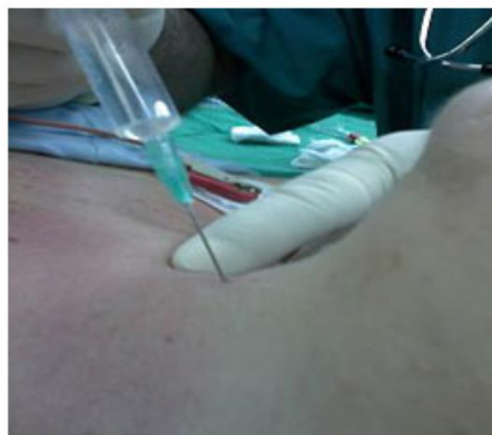
Fig. 2. Infiltración del anestésico local.