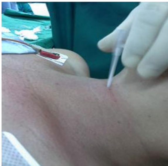
Fig. 3. Punción de la membrana cricotiroides.