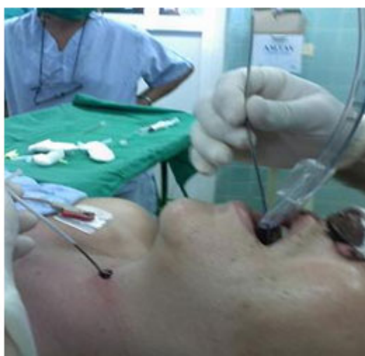
Fig. 6. Paso del tubo endotraqueal a través de la guía.

- Posteriormente se comprobó su correcta colocación y se procedió a realizar inducción anestésica planificada (Figura 7).