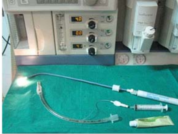
Figura 2. Estilete iluminado.

En 1977, Foster, usó una fibra óptica en un niño con trismos, y Ducrow, al siguiente año empleó una luz flexible (Flexilum) con el mismo principio.