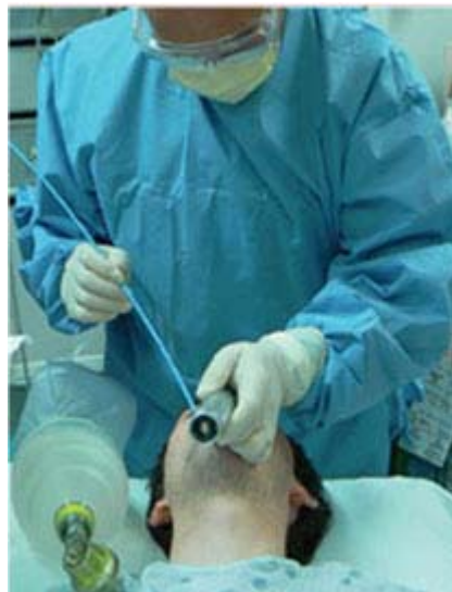
Figura 1. Guía de Eschmann.

Es una guía elástica, semirrígida, de poliéster trenzado ("gum elastic bougie") que lleva usándose en la práctica clínica más de 35 años, sobre todo en Europa. Tiene 60 cm. de longitud con marcaciones a intervalos de 10 cm. y puede usarse con tubos endotraqueales de 6.0 mm o más de diámetro interno. Los 3.5 cm. distales tienen una angulación de aproximadamente 40 grados. Su flexibilidad puede incrementarse con precalentamiento local. Puede ser esterilizada y reusada (Fig. 1).