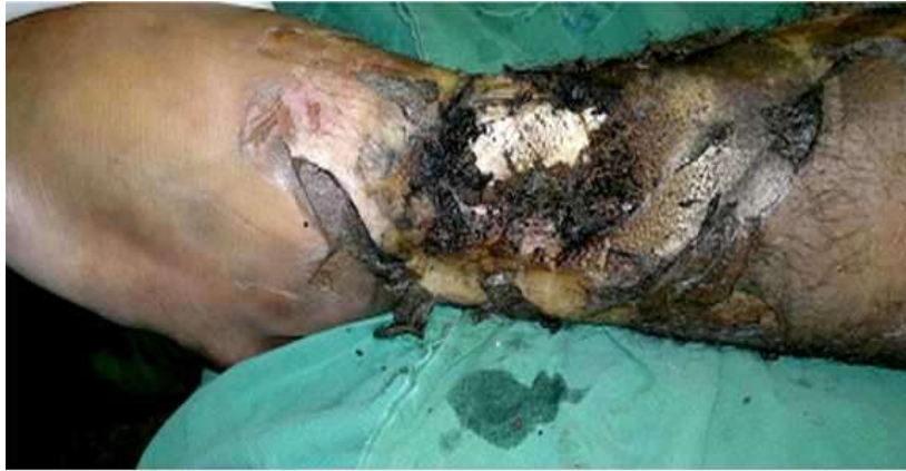
Fig. 1. Lesión aguda miembro inferior con quemadura tipo B.