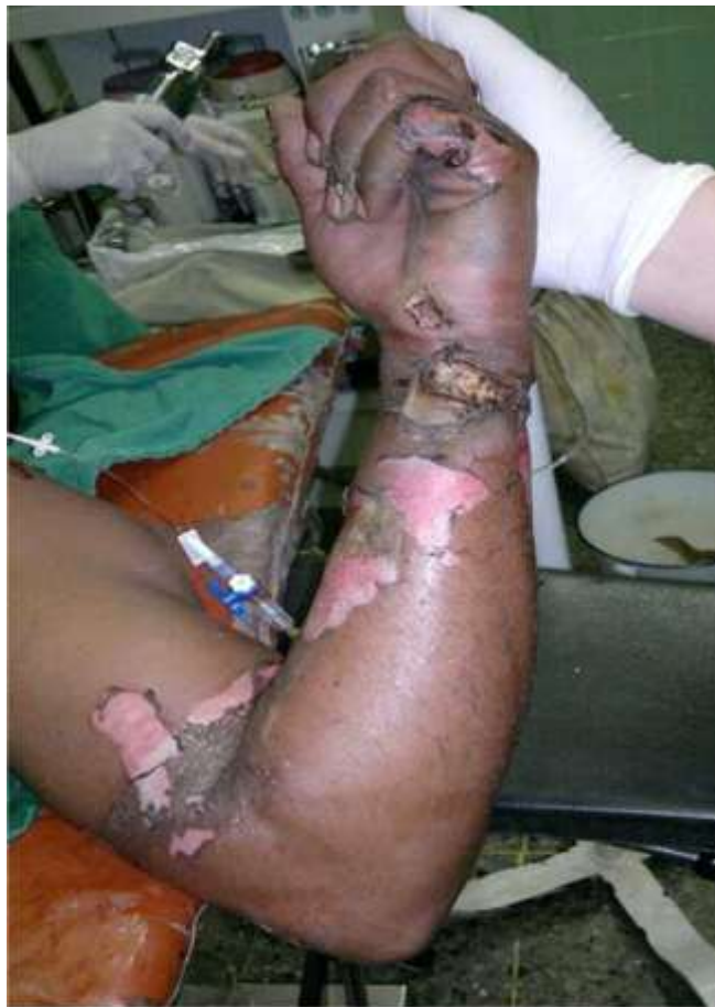
Fig. 2. Tetania de miembro superior (1 hora de evolución).